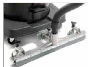
POSSIBILITE SUCEUR FIXE