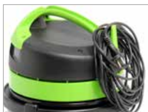
CROCHET POUR CÂBLE