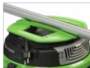
POIGNÉE ERGONOMIQUE AVEC ENROULEUR DE CÂBLE INTÉGRÉ