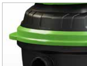
PROTECTION LATÉRALE CONTRE LES PORTES ET LES MURS